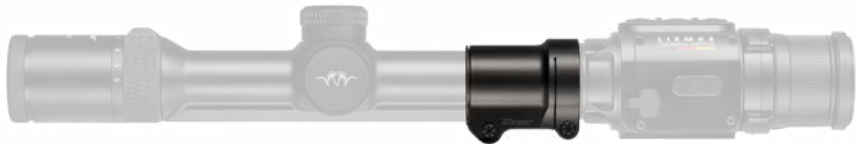
Blaser B2 1–6x24 iC S

Verdrehgesichert, gegen Abziehen nach vorne verriegelt und geklemmt