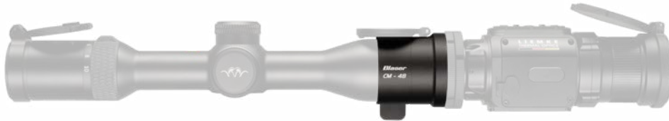
Blaser B2 1.7–10x42iC