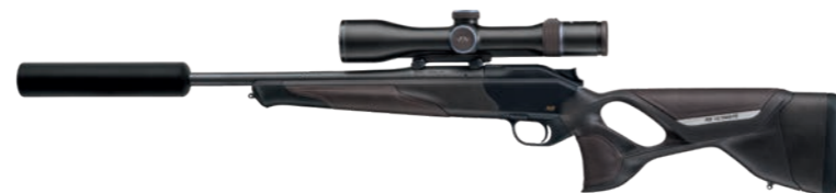
Abb. zeigt R8 Ultimate Leather mit Blaser Over-Barrel Schalldämpfer und Lauflänge 470mm.

ACHTUNG: Gefahr durch Feuer oder Splitter, Spreng- und Wurfstücke. Von Hitze, heißen Oberflächen, Funken, offenen Flammen sowie anderen Zündquellen fernhalten. Nicht rauchen.